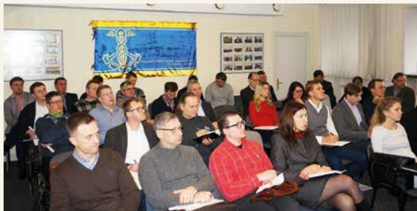
Renginyje dalyvavo apie 40 verslo atstovų

joje reglamentuoja visas darbo sąlygas ir užmokestį. Nesilaikant šių reikalavimų gresia baudos ar net statybų uždarymas. RŽ inf.