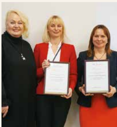
Įteiktos padėkos metinio bendruomenės renginio rėmėjams