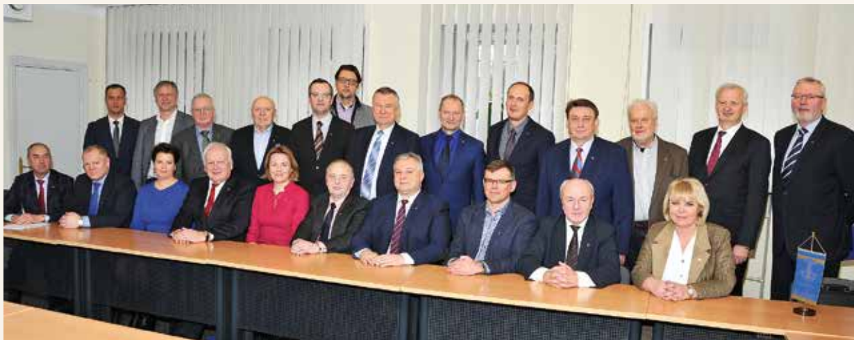
Rūmų taryba apsvairstė organizacijos veiklą praėjusiais metais

Projektas „Erasmus for Young Entrepreneurs“ ugdo būsimų Europos verslininkų įgūdžius, mainuose dalyvauja tiek patyrę, tiek pradėdantys Lietuvos verslininkai. Pradedančiajam verslų rengiami intensyvūs mokymai pas patyrusį verslininką, šis savo ruožtu gali gauti naujų, pažangių idėjų ar įgūdžių naujoje srityje.