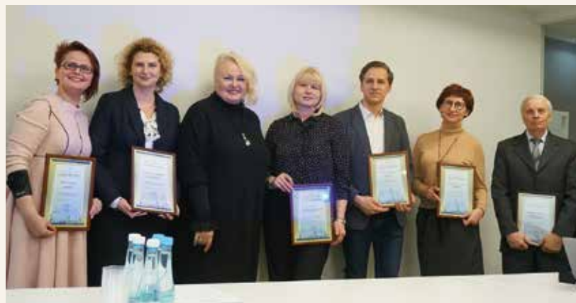
Pasveikinti nauji nariai