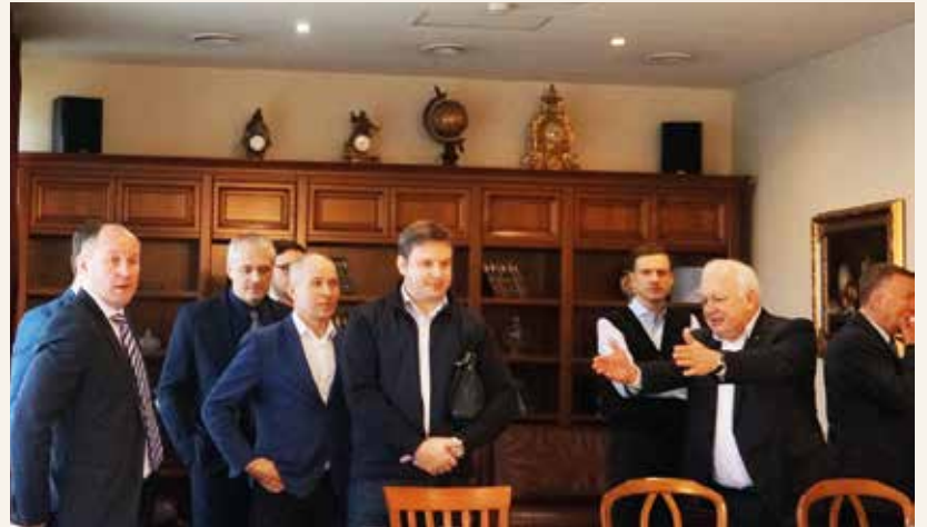
Susitikimas vyko „Best Baltic Kaunas“ viešbučio „Bibliotekos“ salėje

tinio aplinkkelio, HE ir kitų tiltų, viadukų, su „Rail Baltica“ trasa susijusių statybų darbus. Numatoma, kad pietrytinis aplinkkelis bus baigtas iki 2019 m. Per kelerius metus, iki 2019 m. lapkričio, bus rekonstruota ir visa Laisvės alėja iki Vilniaus gatvės.