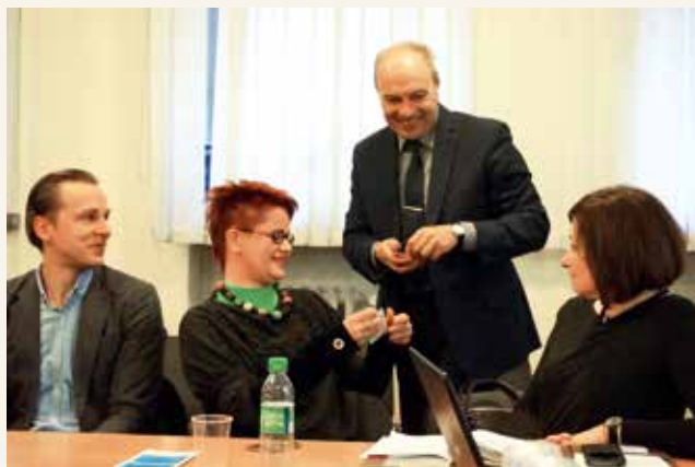
Penktadienio kava tampa tradiciniu verslo kontaktų renginiu

Verslo kontaktų renginiuose paaiškėja, kad vieni kitiems gali būti reikalingi, naudingi ir įdomūs. Kam svarbu nišiniai draudimo produktai, kam teisinės ar mokesčių konsultacijos, kam aktualu personalo paieškos paslaugos ar laisvalaikio pramoga... Prie kavos bendraujantys