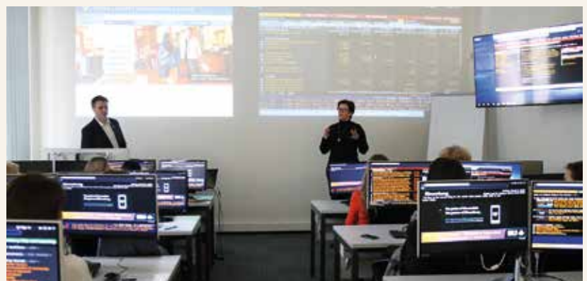
Finansininkai susipažino su pirmąja Lietuvoje ir Baltijos šalyse informacine platforma

Kauno finansininkų klubo nariai lankėsi išskirtinėje laboratorijoje. Ji įsteigta KTU Ekonomikos ir verslo fakultete su pasaulyje pirmaujančia finansinės informacijos teikėja JAV bendrove „Bloomberg“.