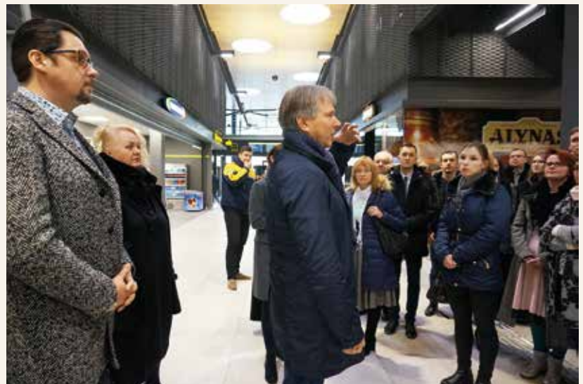
Rūmų nariai domėjosi stoties statyba ir naujovėmis