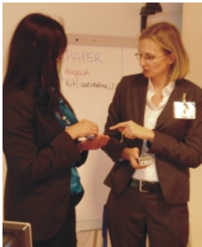
Projekto parengiamasis susitikimas Turine, 2009 m. balandžio 6–8 dienomis.