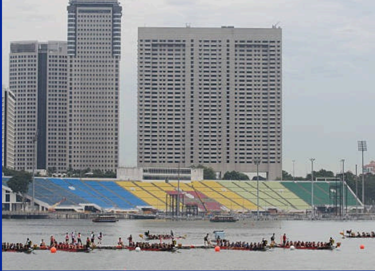
SINGAPŪRAS: BANKŲ REGATA „MARINA BAY“ ILANKOJE