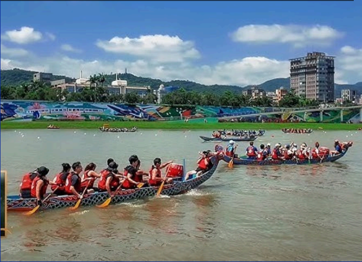
TAIPĖJUS: VERSLO ELITO REGATA PRIE „TAIPEI 101“ FINANSŲ CENTRO