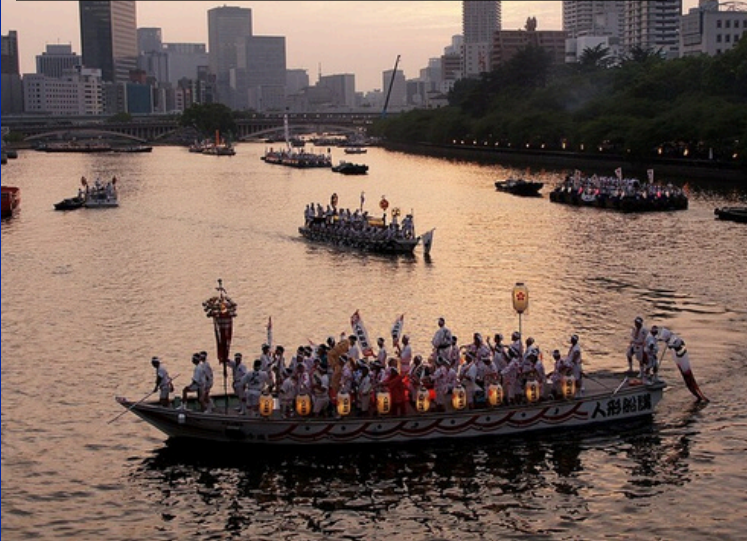
JAPONIJA: KORPORATYVINĖ REGATA VERSLO CENTRE